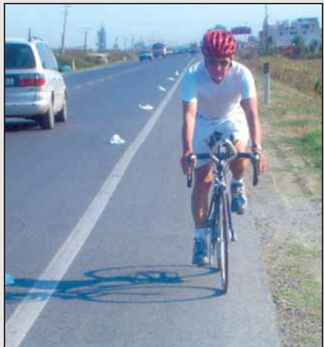
Pjesëmarrës në aktivitetin e "Triatlonit"

18 Shtator Inagurimi i Triatlonit në Shqipëri Për herë të parë në Shqipëri u inagurua organizimi i garës së Triatlonit. Ky aktivitet që përfshin 3 sporte not, çiklizëm dhe atletikë, u organizua në qytetin e Durrësit në plazhin e golemit. Aktiviteti i iniciuar dhe sponsorizuar nga Louis Berger SAS u organizua me mbështetje të KOKSH, Federatës së Notit, Ciklizmit dhe Atletikës.