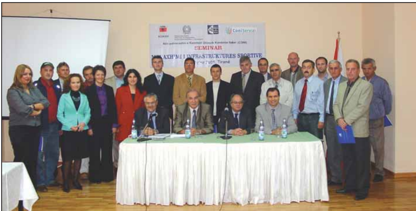
Nga seminari: “Menaxhimi i infrastrukturës sportive”