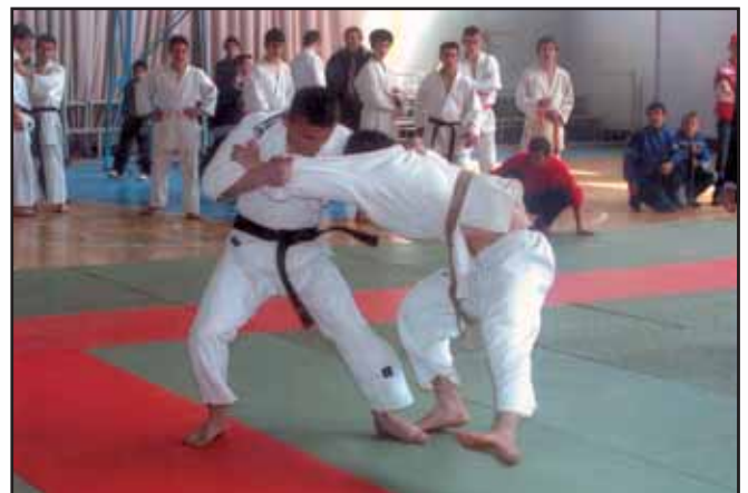
Nga Kampionati Mbarëkombëtar i JUDO-s, Shkodër

Federata Shqiptare e Judos, më datë 23 Tetor 2005, në pallatin e sportit "Qazim Dervishi" të qytetit të Shkodrës, ka organizuar Kampionatin e 5-të Mbarëkombëtar për të rritur femra dhe meshkuj. Në këtë veprimtari morrën pjesë 41 meshkuj dhe 15 femra, ndërsa ekipet pjesëmarrëse ishin Shqipëria, Kosova, Diaspora dhe Shqiptarët e Maqedonisë. Ekipi Kosovar u shpall dhe ekipi më i mirë.