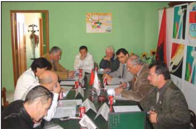
Nga takimi me Federatat, Bursat Olimpikë Pekin 2008