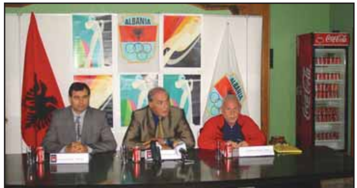
Nga konferenca për shtyp "Torino 2006" KOKSH, FSH Ski

Lidhur me këtë eveniment për të promovuar këtë fakt si dhe përpjekjet që duhen bërë për një prezantim