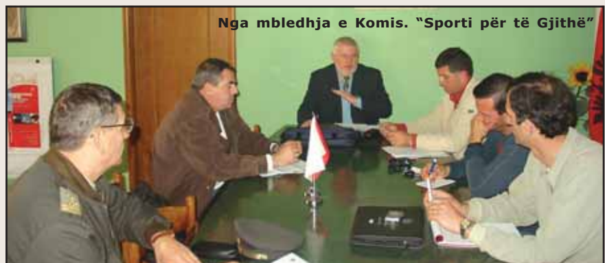
Nga mbledhja e Komis. “Sporti për të Gjithë”

- Diskutim për realizimin e një tryeze të rumbullakët në shkallë kombëtare, në bashkëpunim me institucionet shtetërore dhe ato private, për të gjitha aspektet e “Sportit për të Gjithë” në Shqipëri.