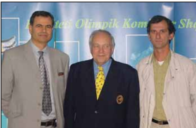
Nga vizita e Fed. Europiane e Badmintonit në KOKSH