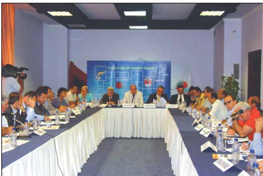
Nga tryeza e rrumbullakët mbi strategjinë e "Pekin 2008", "Pescara 2009"

K OKSH organizoi Tavolinën e Rrumbullakët e aktorëve të pjesëmarrjes në "Almeria 2005", në "Tirana International" Hotel.