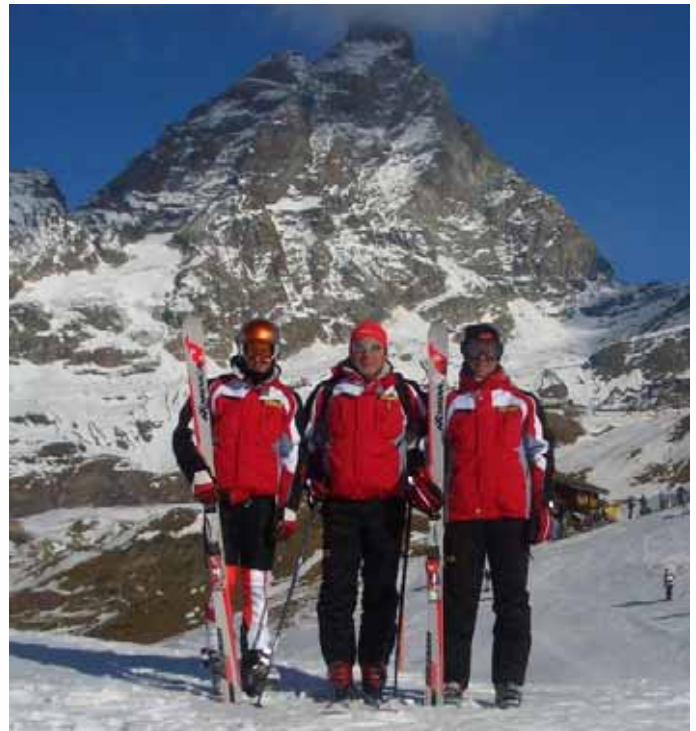
Ekipi Olimpik Dimëror Shqiptar në një nga seancat stërvitore në Fshatin Olimpik