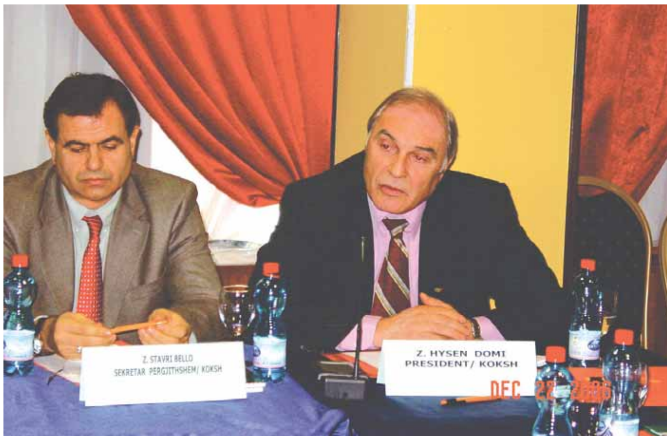
Presidenti i KOKSH dhe Sekretari i Përgjithshëm në punimet e Tryezës, organizuar nga MTKRS

hjen e parë e cila u zhvillua pranë MTKRS në datën 16 Nëntor 2006. Në këtë mbledhje u diskutua për masat parandaluese dhe bashkëpunimin ndërinstitucional për parandalimin e fenomeneve të dhunës gjatë zhvillimit të aktiviteteve sportive.