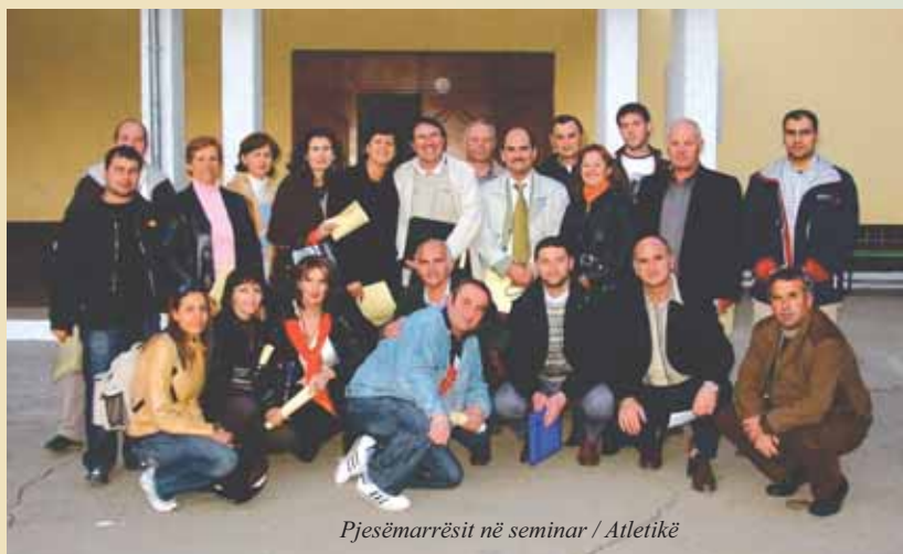
Pjesëmarrësit në seminar / Atletikë

KOKSH në mbështetje të Sportit të Atletikës – Projekti “Zhvillimi i Strukturës Kombëtare Sportive”, në kuadër të projekteve të vazhdueshme të mbështetura nga Solidariteti Olimpik,