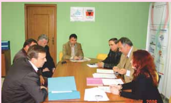
Përfaqësuesit e FSHF dhe Futboll Klub Burrelit në Seancën e KAS

07/12/2006 K.A.S (Këshilli i Arbitrazhit Sportiv) u mbledh për shqyrtimin e çështjes me palë : Ankues: Futboll Klub "BURRELI" Kundra: Federata Shqiptare e Futbollit, Me objekt: Ndryshimin e vendimit nr. 853 dt. 25/11/2006 të Komisionit të Apelit të F.SH.F. duke përcaktuar si masë dënimi atë maksimale të parashikuar në nenin 24/1,2,3. i K D S.