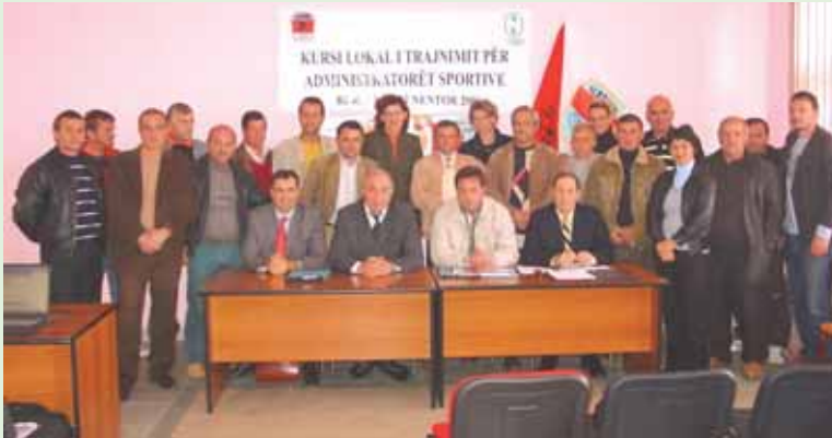
Pjesëmarrësit në kursin Lokal të Administratorëve Sportivë, Burrel

KOKSH në vijim të projekteve për informimin dhe azhurnimin e drejtuesve lokalë sportivë me të rejtat dhe