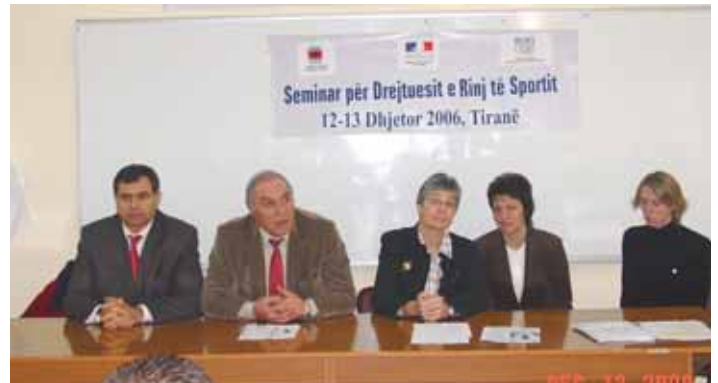
Nga ceremonia e çeljes së seminarit