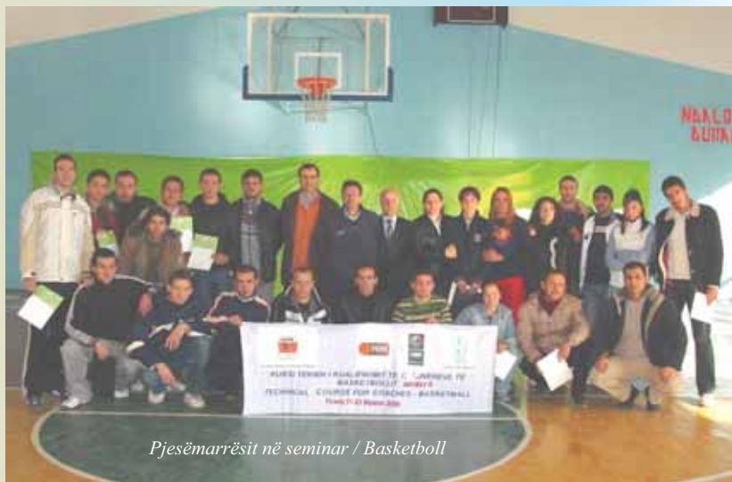
Pjesëmarrësit në seminar / Basketboll

Ky Program Botëror 4-vjeçar 2005-2008 ka për qëllim formimin e vazhdueshëm të trainerëve dhe arritjen e një trajnimi standart, cilësor dhe bashkëkohor, në të gjithë botën. Njëkohësisht, këto kurse do të do të ndihmojnë në ngritjen e një sistemi për kualifikimin e trajnërëve në nivel kombëtar.