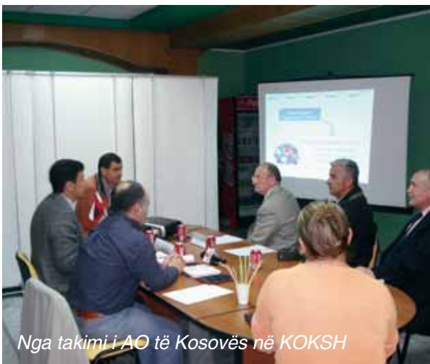
Nga takimi i AO të Kosovës në KOKSH