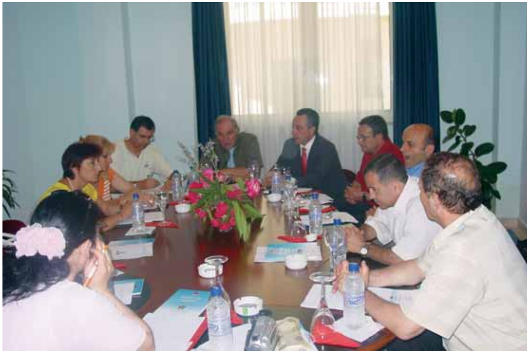
Nga mbledhja e Komitetit Ekzekutiv, Hotel Leonardo

Komiteti Ekzekutiv i KOKSH zhvilloi mbledhjen e saj të radhës në ambjentet e Hotel “Leonardo”, shkëmbi i Kavajës Durrës. Anëtarët e KE diskutuan mbi përgatitjet dhe marrejn e masave, në kuadër të organizimit të Asamblesë së 11-të vjetore të KOKSH e cila do të mbahet më datë 3 Qershor 2006, po në hotel “Leonardo”.