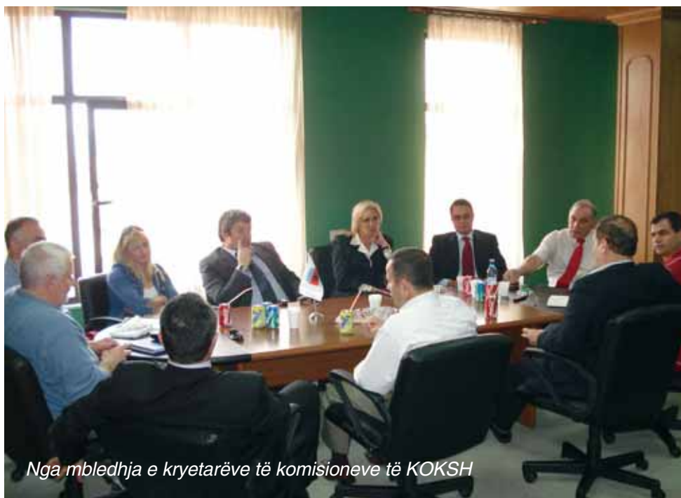
Nga mbledhja e kryetarëve të komisioneve të KOKSH

Përfaqësues të sportit të Bridge (lojë me letra), sport i ri ky në Shqipëri, u pritën nga Sekretari i Përgjithshëm i KOKSH z. Bello. Në takim u bisedua mbi anëtarësimin e këtij sporti pranë KOKSH e cila ka marrë aprovimin paraprak të Komitetit Ekzekutiv, por vendimi përfundimtar për njohjen e saj do të merret në Asamblenë e 11 vjetore të KOKSH. Nga përfaqësuesit e këtij sporti u konfirmua se së shpejti ky sport do të zhvillojë asamblenë e tij të parë.