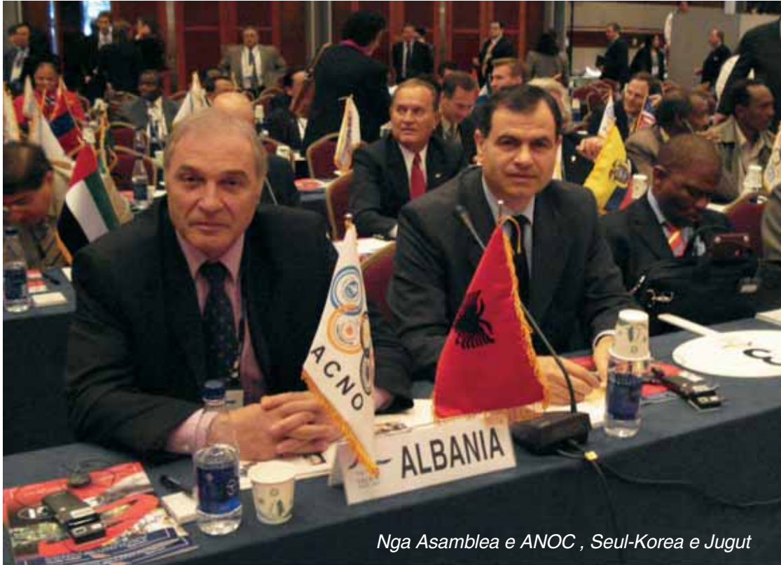
Nga Asambleja e ANOC , Seul-Korea e Jugut