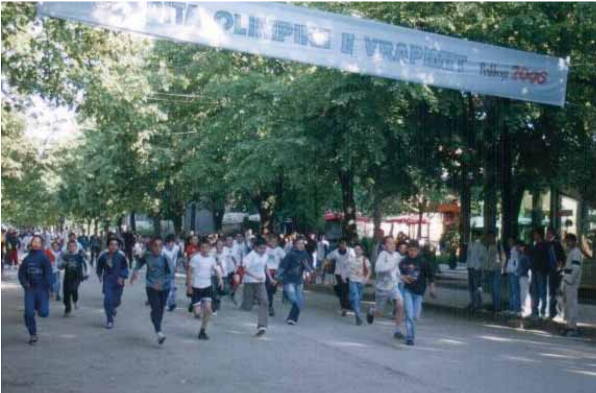
Nga Dita Olimpikë e Vrapimit – Peshkopi 2006

Në qytetin e Peshkopisë, me mbështetjen e KOKSH, është organizuar “Dita Olimpikë e Vrapimit, Peshkopi-2006”. Gjatë dy ditëve në këtë veprimtari Olimpikë, morën pjesë aktivisht nxënësit e shkollave të mesme “Seid Najdeni”, “Nazmi Rushiti” dhe shkollat 9-vjeçare të qytetit të Peshkopisë “Selim Alliu”, “Demir Gashi”,