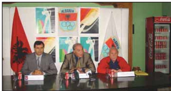
Nga konferenca për shtyp "Torino 2006" KOKSH, FSH Ski

Lidhur me këtë eveniment për të promovuar këtë fakt si dhe përpjekjet që duhen bërë për një prezantim