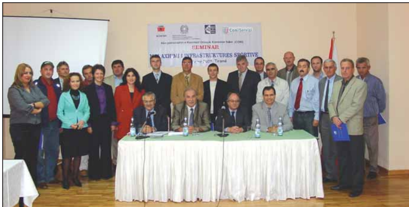
Nga seminari: “Menaxhimi i infrastrukturës sportive”