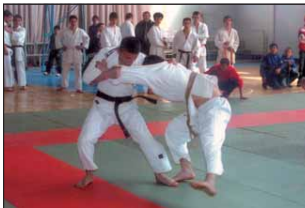
Nga Kampionati Mbarëkombëtar i JUDO-s, Shkodër

Federata Shqiptare e Judos, më datë 23 Tetor 2005, në pallatin e sportit "Qazim Dervishi" të qytetit të Shkodrës, ka organizuar Kampionatin e 5-të Mbarëkombëtar për të rritur femra dhe meshkuj. Në këtë veprimtari morrën pjesë 41 meshkuj dhe 15 femra, ndërsa ekipet pjesëmarrëse ishin Shqipëria, Kosova, Diaspora dhe Shqiptarët e Maqedonisë. Ekipi Kosovar u shpall dhe ekipi më i mirë.