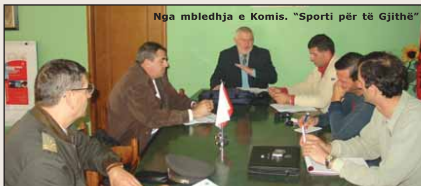
Nga mbledhja e Komis. “Sporti për të Gjithë”

- Diskutim për realizimin e një tryeze të rrumbullakët në shkallë kombëtare, në bashkëpunim me institucionet shtetërore dhe ato private, për të gjitha aspektet e “Sportit për të Gjithë” në Shqipëri.