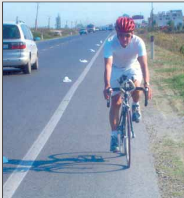
Pjesëmarrës në aktivitetin e "Triatlonit"

18 Shtator Inagurimi i Triatlonit në Shqipëri Për herë të parë në Shqipëri u inaguroa organizimi i garës së Triatlonit. Ky aktivitet që përfshin 3 sporte not, çiklizëm dhe atletikë, u organizua në qytetin e Durrësit në plazhin e golemit. Aktiviteti i iniciuar dhe sponsorizuar nga Louis Berger SAS u organizua me mbështetje të KOKSH, Federatës së Notit, Ciklizmit dhe Atletikës.