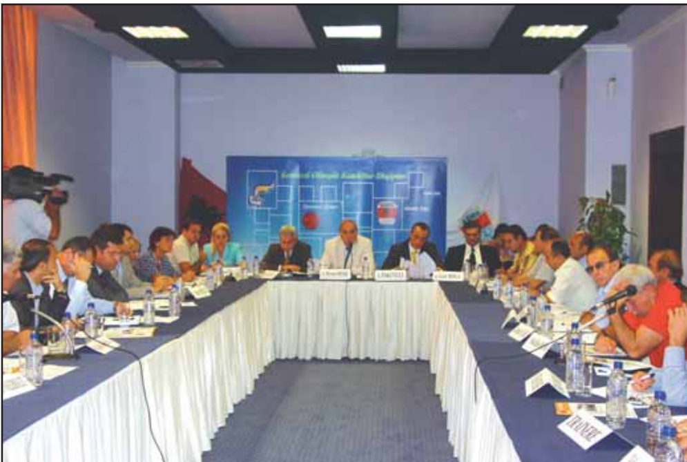
Nga tryeza e rumbullakët mbi strategjinë e "Pekin 2008", "Pescara 2009"

K OKSH organizoi Tavolinën e Rumbullakët e aktorëve të pjesëmarrjes në "Almeria 2005", në "Tirana International" Hotel.