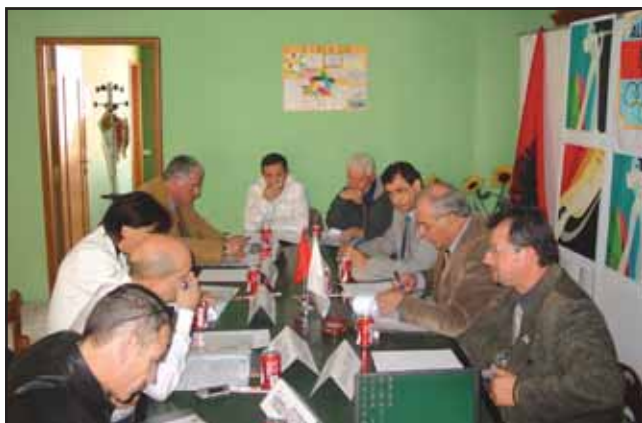
Nga takimi me Federatat, Bursat Olimpikë Pekin 2008