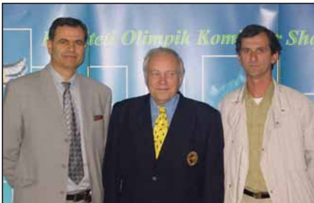
Nga vizita e Fed. Europiane e Badmintonit në KOKSH