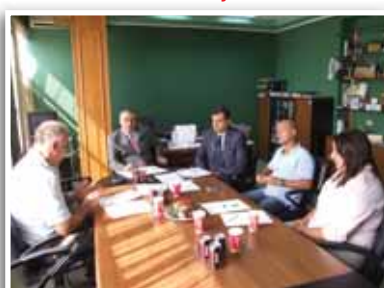
Komisioni Financë Marketing