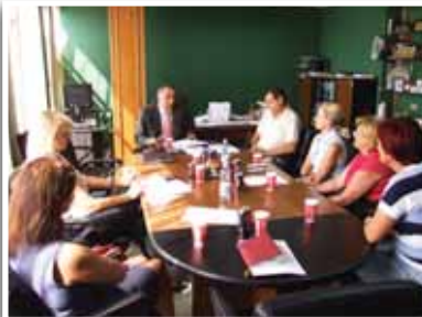
Komisioni Femra dhe Sporti

Anëtarët e këtyre Komisioneve parashtruan problematika dhe çështje që kërkojnë vëmendje, si dhe u diskutua për mënyra për ti angazhuar më shumë këto komisione dhe për ta bërë rolin e tyre sa më efikas.