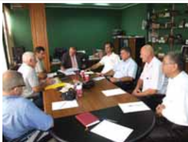
Komisioni Sporti për të Gjithë